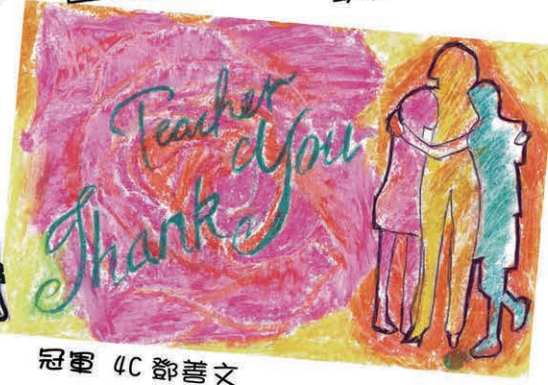
冠軍 4C 鄧善文