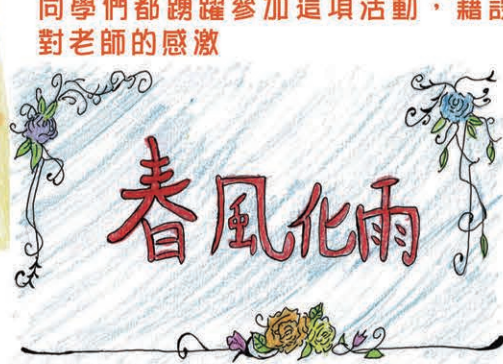
亞軍 3B 張婉桂