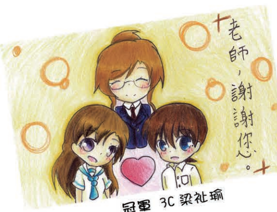
冠軍 3C 梁祉瑜