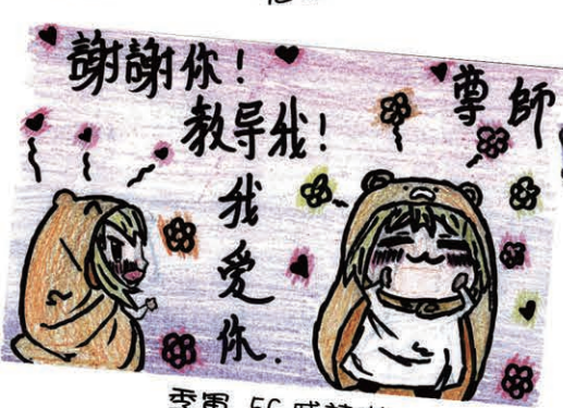
季軍 5C 戚詩琪