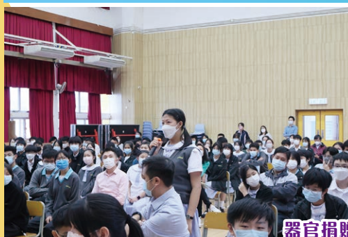
器官捐贈專題講座