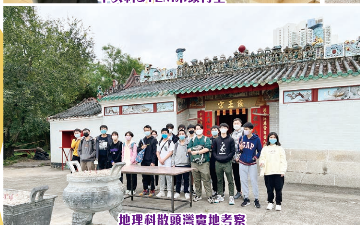
地理科散頭灣實地考察