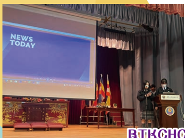
BTKCHC Daily news