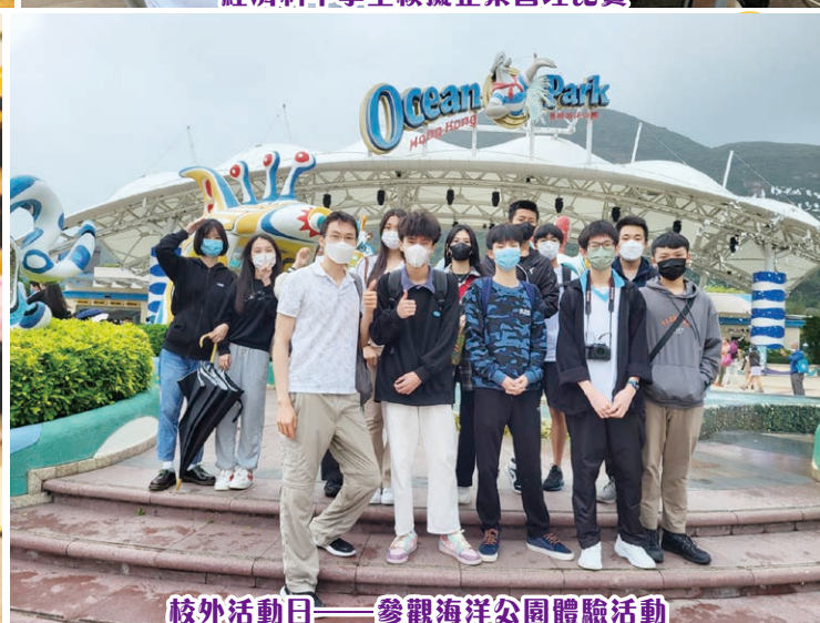
校外活動日——參觀海洋公園體驗活動