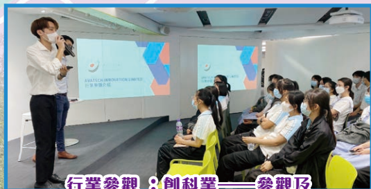
行業參觀：創科業——參觀及創新科技技能工作坊

本校已於2020年參加「賽馬會鼓掌·創你程計劃」，於2022年成為計劃的資源學校，並透過計劃的誼友支援及其他配套，為不同學校及社區持分者提供跨界別合作支援。與此同時，本校運用「香港生涯發展自評基準」(HKBM)進行自我評估，以建立可持續的全校性生涯發展計劃。