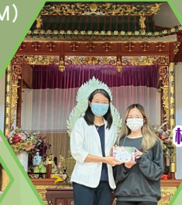
校友分享——學習技巧工作坊