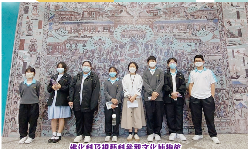
佛化科及視藝科參觀文化博物館