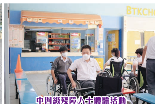
中四級殘障人士體驗活動