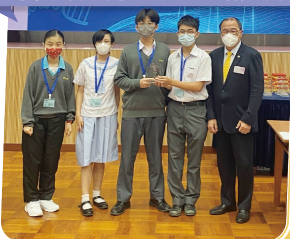
全港中小學風力發電機STEM創作大賽2022