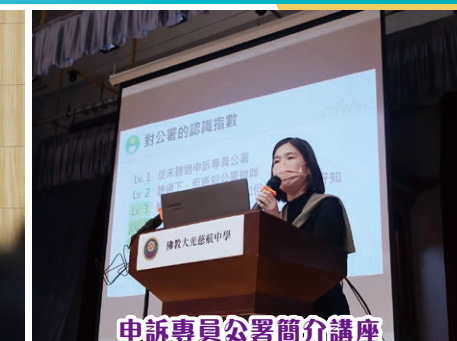
申訴專員公署簡介講座