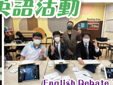
English Debate Team competition