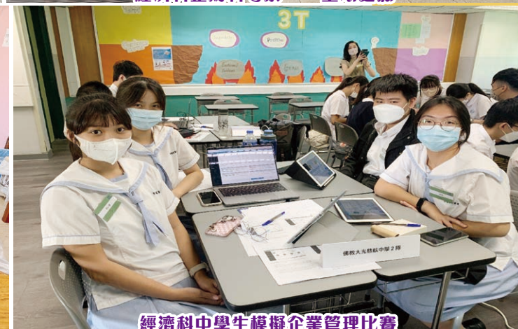
經濟科中學生模擬企業管理比賽