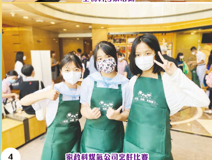
家政科煤氣公司烹飪比賽