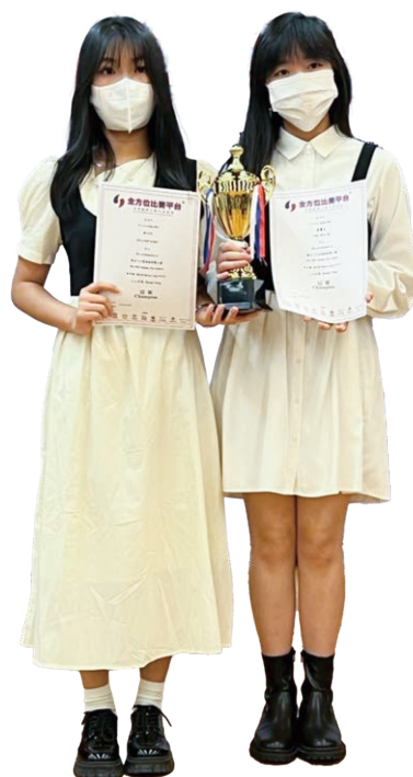
超新聲歌唱比賽（二人合唱冠軍）