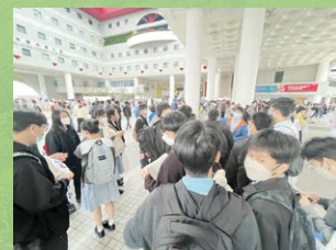
香港科技大學本利入學資訊日

2021-2022學年開始擔任本校的生涯規劃大使，與本校師生合作舉辦不同類型的活動，並致力提升校內及公眾對生涯發展的認識，推動各界對青年人生涯發展的反思。