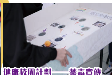
健康校園計劃——禁毒宣傳