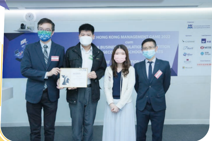
中學生模擬企業管理比賽優異獎