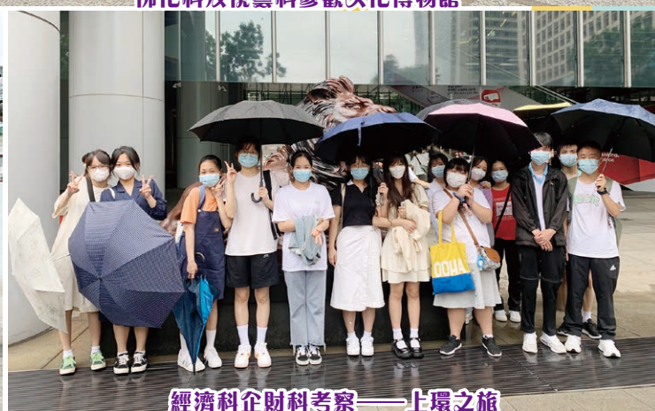
經濟科企財科考察——上環之旅